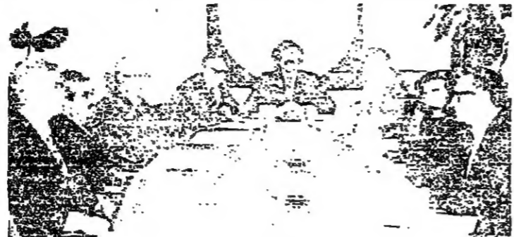
اجتماع مجلس ادارة بنك المشرق